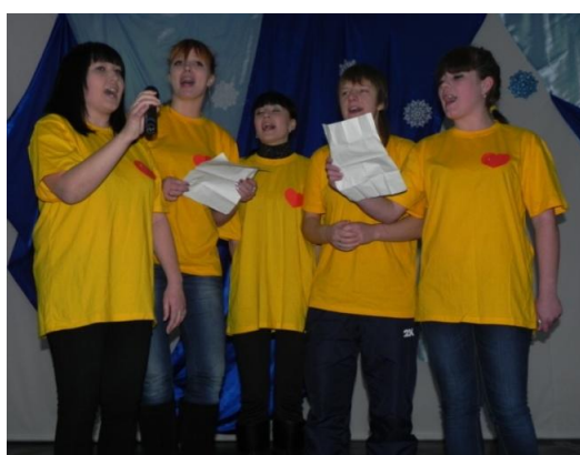
Приветственные слова от членов жюри